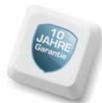
3. 10 Jahre Garantie