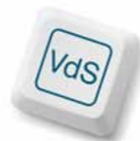
4. VdS zertifiziert